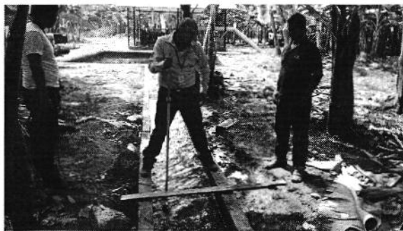
Fotografía 4. Izq. Entrega de oficio, Der. Aforo de caudal en la captación