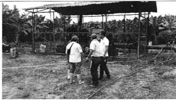
Fotografía 3. Izq. Entrega de oficio, Der. Visita al sitio de captación y conducción