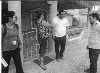
Entrevista e inspección técnica de afectación.