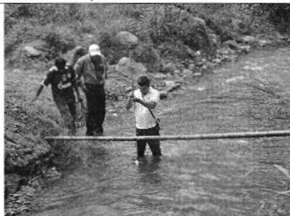
Aforo de caudales en captaciones inspeccionadas.