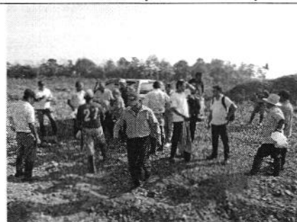
Reunión con los involucrados en el caso denunciado.