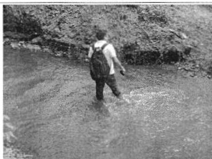
Inspección técnica Río Chanchan.