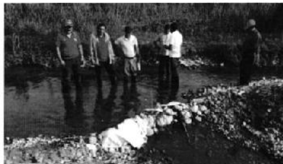
Profesionales ARCA y SENAGUA en inspección a Usuarios para verificar información sobre afectación a la cantidad de agua del río Chanchán – Marcelino Maridueña - Guayas