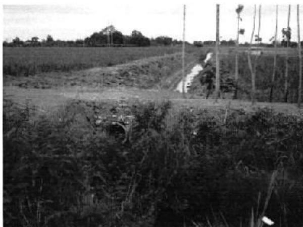
Profesionales ARCA en inspección a Usuario afectado por la construcción de obras de drenaje, Taura Naranjal - Guayas