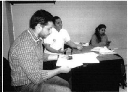
Profesionales ARCA y EPA en reunión de coordinación y socialización con funcionarios de la Gerencia de Comercialización de la EPA – EP Guayaquil y Subsecretaría de la DH Guayas