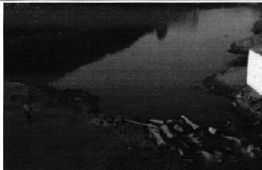
Profesionales ARCA en inspección a Usuarios Ilegales sobre afectaciones a la cantidad del agua y obstrucción al flujo natural, El Triunfo - Guayas