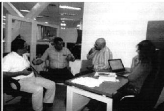
Profesionales ARCA en reuniones de trabajo y gestiones en el CAC Guayaquil – DH Guayas y en la Empresa Pública del Agua para obtener las Certificaciones