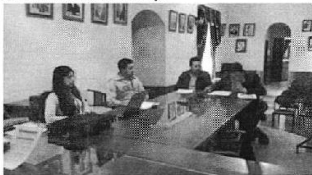
Ilustración 1. GADM de Pujilí