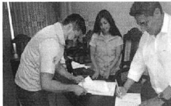
Ilustración 6. GADM de Camilo Ponce Enríquez