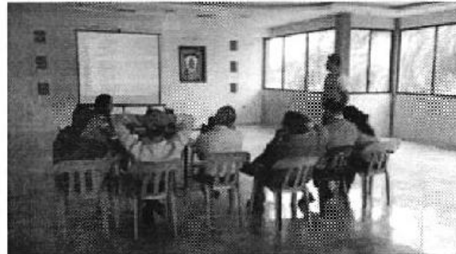
Ilustración 7. GADM de Balao