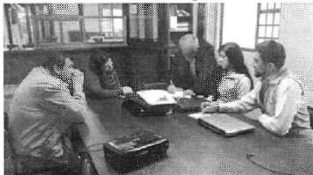
Ilustración 3. GADM de Chordeleg