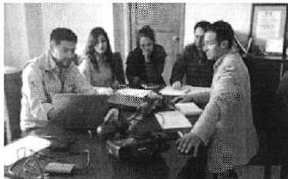
Ilustración 4. GADM de Pucará