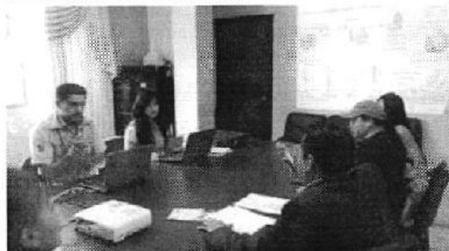
Ilustración 5. GADM de Chilla