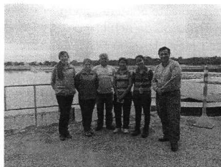
Fotografía 2. Participantes de SENAGUA-ARCA-INTERAGUA en inspección a PTAR Guayacanes Samanes