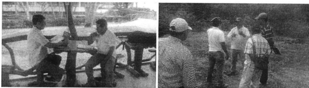
Fotografía 3. Recopilación de Información en el predio NATURISA S.A.