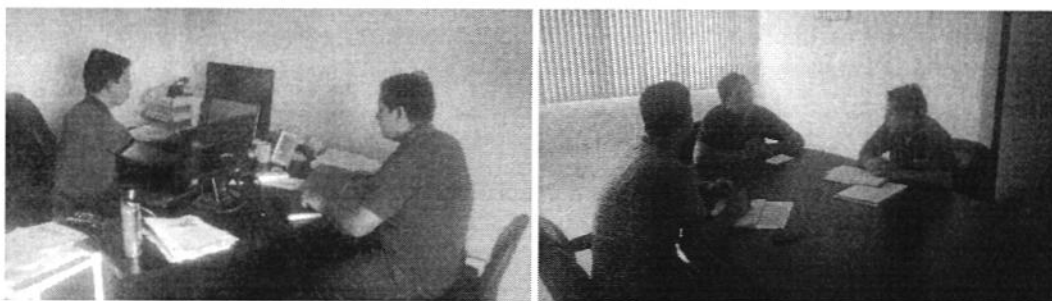
Fotografía 2. Recopilación de Información en el predio RIBABERTO.