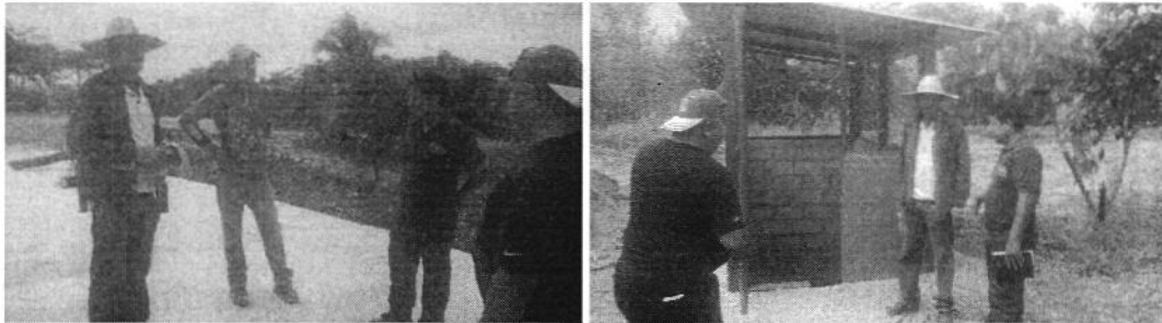
Fotografía 4. Recopilación de Información en el predio JUANPA S.A.