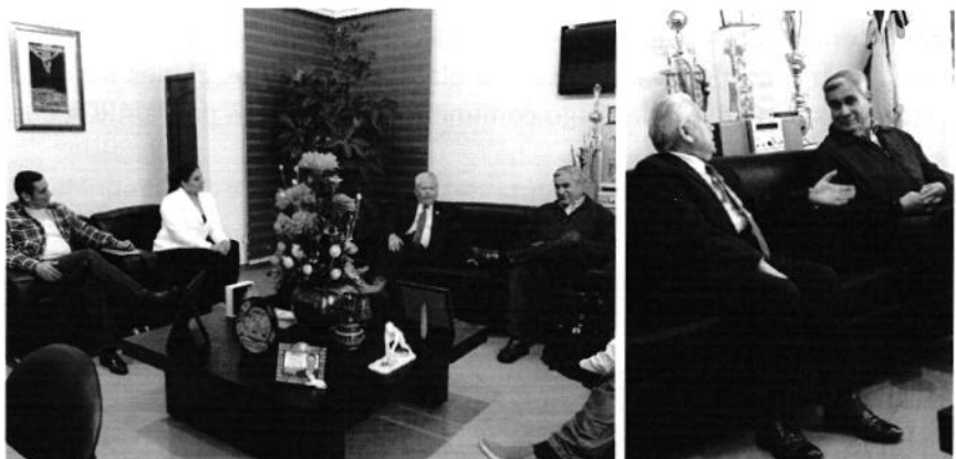
Funcionarios de la ARCA, SENAGUA y autoridades de UPCARCHI, en reunión de trabajo y análisis de la firma de renovación de convenio de cooperación interinstitucional.