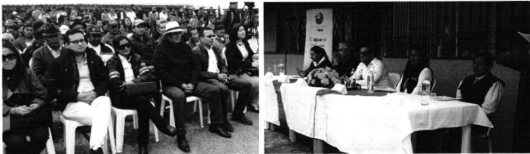
Funcionarios de SENAGUA, ARCA y miembros de la parroquia de Santa Martha de Cuba en acto de entrega de personería jurídica.