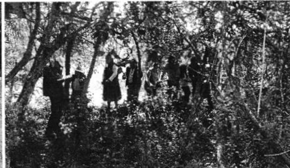
Fotografía 1. Izq. Conversatorio con el Sr. Luis Ángel Maxi, Der. Visita al sitio de captación y conducción