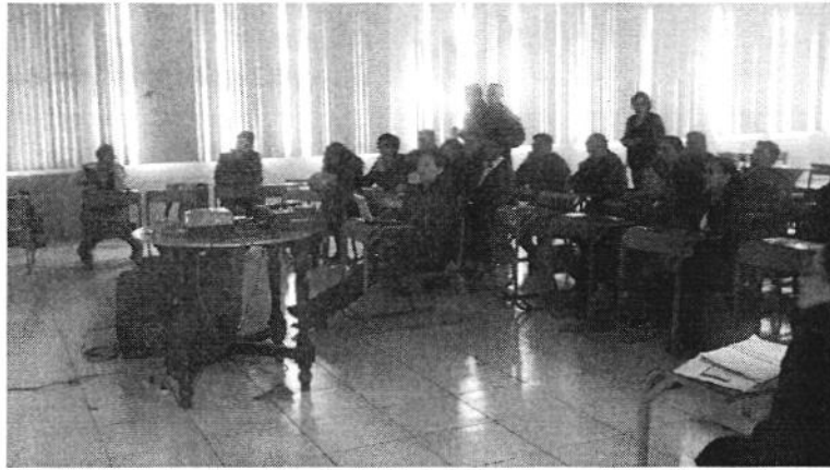
Ilustración 1. Capacitación a la MTT2 del Sub Proceso de Gestión de Riesgos.