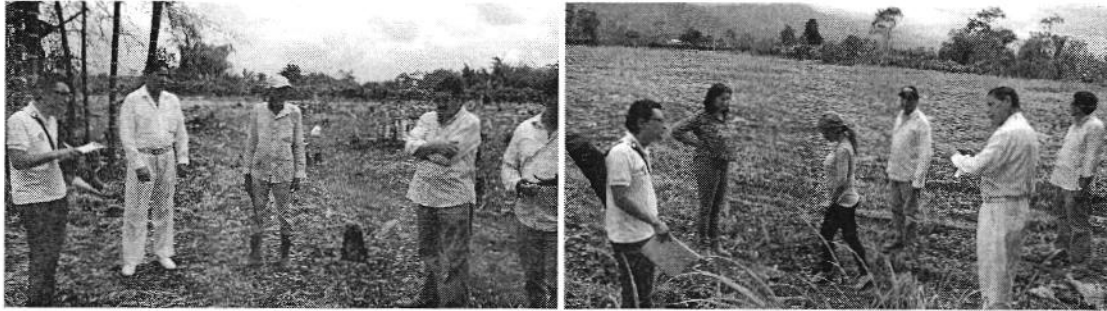
Fotografía 1. Izq. Conversatorio con los representantes de los recintos afectados. Der. Inspección in situ.