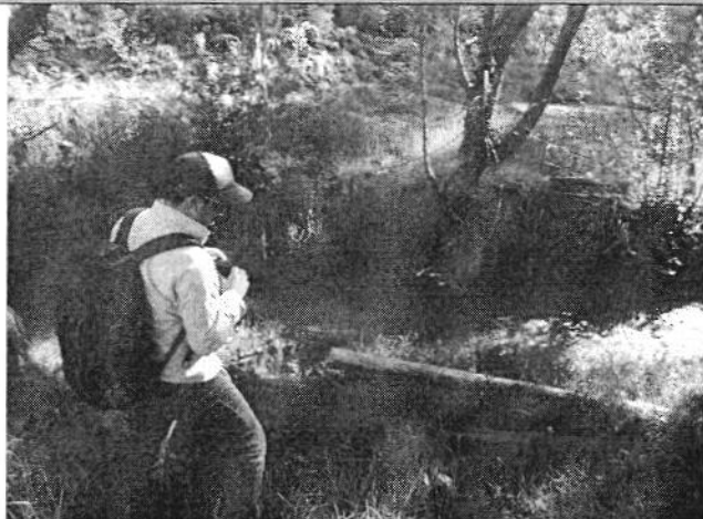
INSPECCIÓN PARROQUIA LLACAO