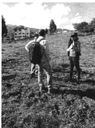
INSPECCIÓN PARROQUIA SININCAY