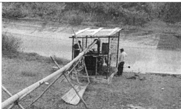
Fotografía 1. Verificación de la instalación de la caseta de bombeo en el Sistema Trasvase Daule – Vínces