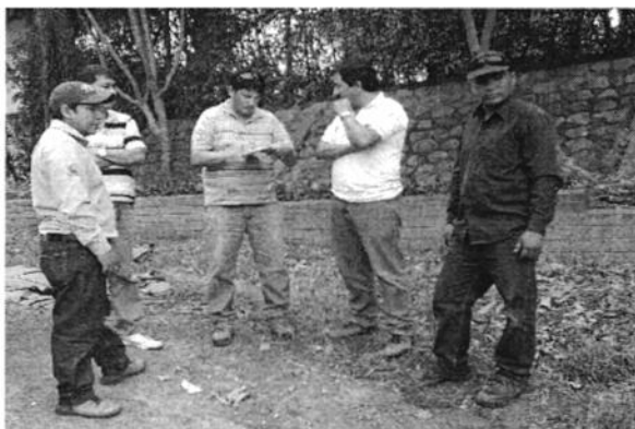
Fotografía 2. Reunión con el Técnico de la EPA – EP