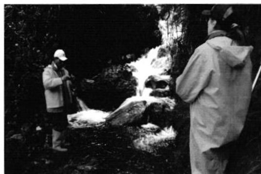
Foto 4. Se procede a realizar la Inspección Técnica en el lugar de captación Nro. 2.