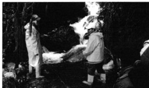
Foto 2. Se procede a realizar la Inspección Técnica en el lugar de captación Nro. 1.