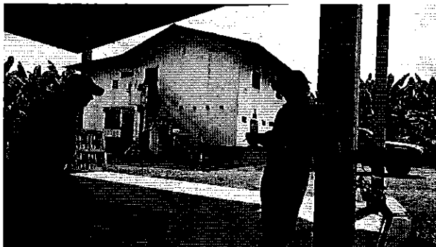
Fotografía 2. Reunión de trabajo Predio del Sr. Jhon Espinoza