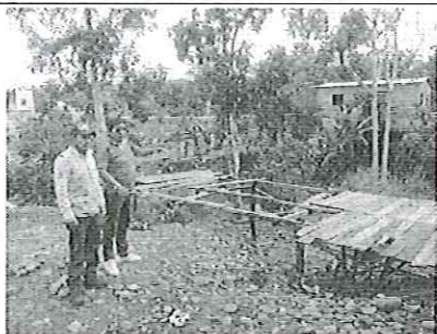
Fotografía 1. Reunión de trabajo en el Estero Seco