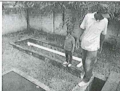
Fotografía 2. Vista a la Planta de Tratamiento