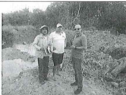
Fotografía 5. Reunión con los asistentes al Rio Salima