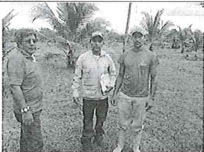
Fotografía 3. Reunión con los asistentes a la Chanchera