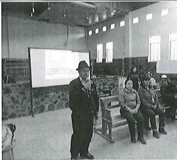
Ilustración 3. Taller con organizaciones en Suscal con participación del Alcalde.