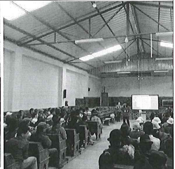
Ilustración 4. Taller con organizaciones de Suscal