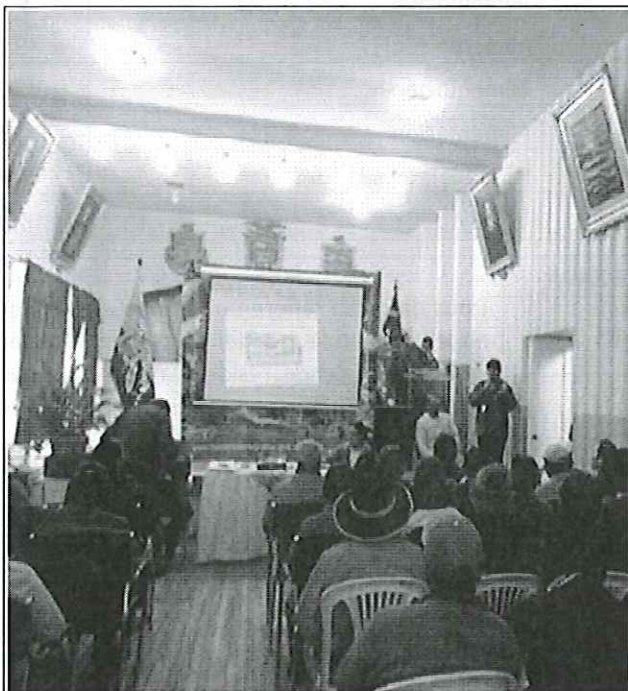
Ilustración 1. Taller con JAAP de Guano