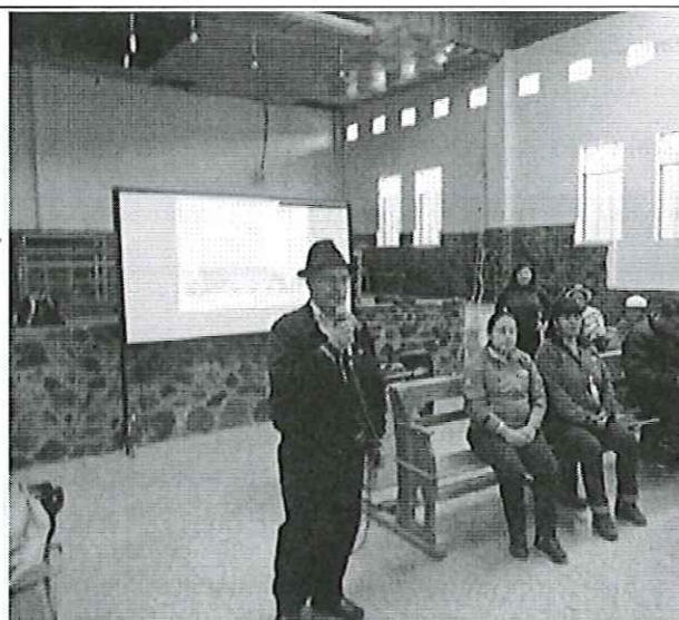
Ilustración 3. Taller con organizaciones en Suscal con participación del Alcalde.