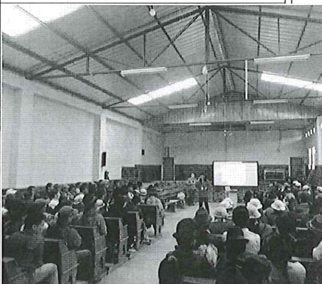
Ilustración 4. Taller con organizaciones de Suscal