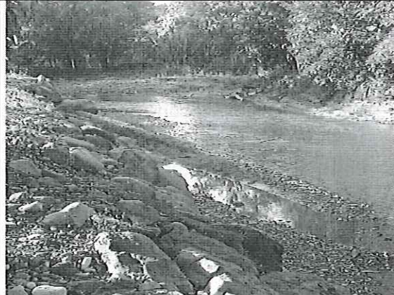
Inspección al Río Dashino