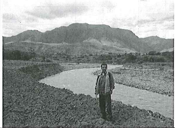
Inspección al Río Rircay