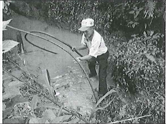
Inspección a la vertiente Cantón Guayco