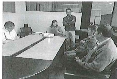
Fotografía 2. Participantes en el Taller Interinstitucional realizada en la Sala de Sesiones de la Dirección Técnica de la Subsecretaría de la DH Santiago – Cuenca - 17-05-2017.