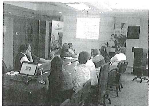
Fotografía 1. Participantes en el Taller Interinstitucional realizada en la Sala de Sesiones de la Subsecretaría de la DH Guayas – Guayaquil - 16-05-2017.