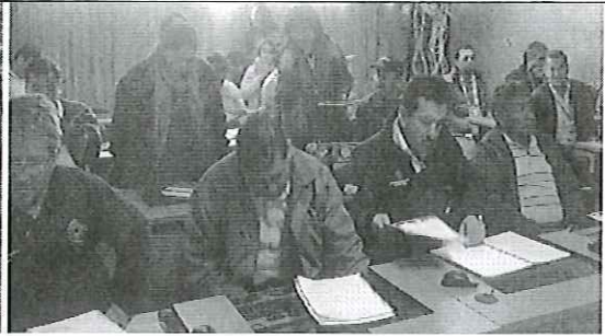
Fotografía 1. Curso sobre Diseño de Sistemas de Riego Tecnificado . Prácticas para la determinación de la capacidad de infiltración de los suelos - 31-05-2017.