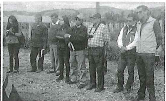
Fotografía 1. Curso sobre Diseño de Sistemas de Riego Tecnificado . Practicas de campo, demostraciones y simulaciones de lluvia 01-06-2017.