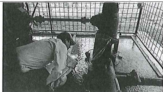
Compañía RUFORCORP S.A.