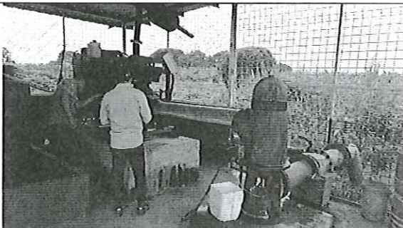
Compañía SUMIFRU Ecuador S.A.