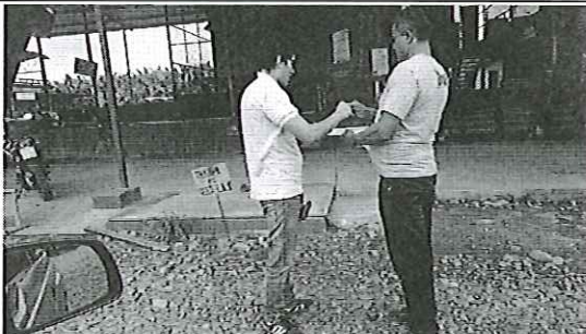
Inspección a Compañía Exportadora e Inportadora Manobal C. Ltda.