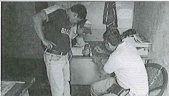
Compañía Agrícola río Ventanas S.A.