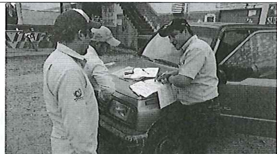
Compañía BANAROYAL S.A. (DOLE)