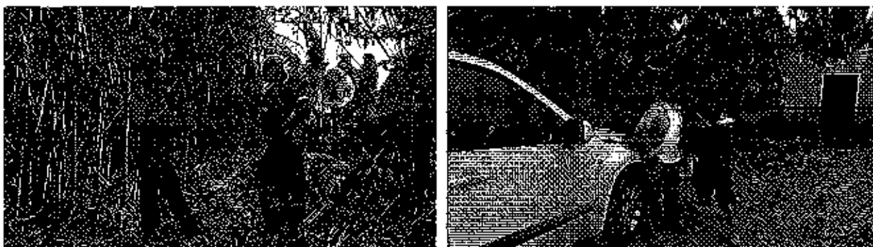
Fotografía 3. Inspección técnica al predio de los señores Ismael Gonzabay y Pablo Correa