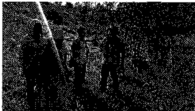
Fotografía 2. Inspección por posible obstrucción al cauce natural del agua en el predio del Sr. Fidel Jaramillo