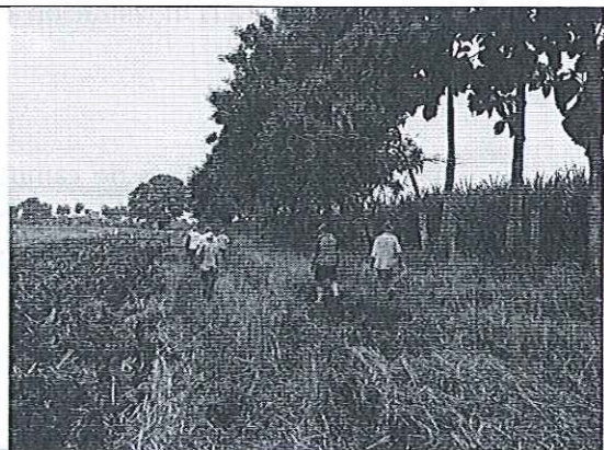
Inspección en el estero Ñauza.