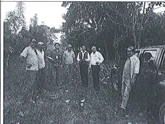
Reunión con ciudadanos involucrados en la denuncia estero Ñauza.