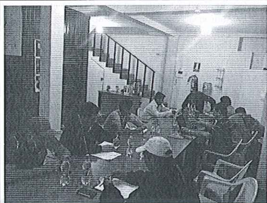
Reunión con representantes de las instituciones invitadas a la inspección.