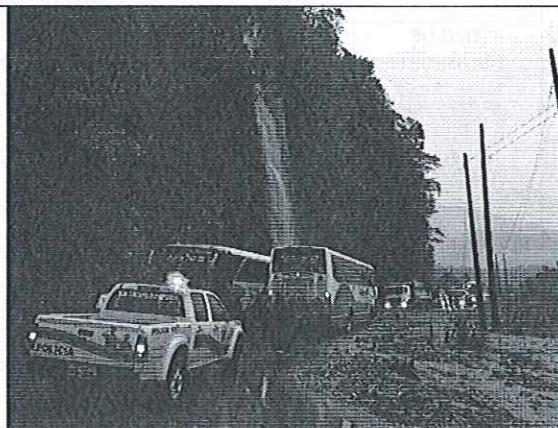
Derrumbe vía Baños-Puyo.