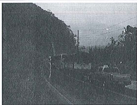
Derrumbe vía Baños-Puyo.