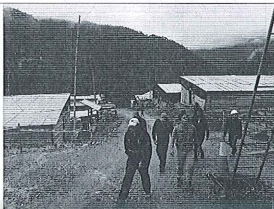
Inspección en el campamento La Esperanza, proyecto Panantza-San Carlos.