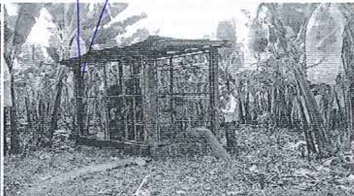
Fotografía 1. Visita técnica y recorrido por las fuentes hídricas en el predio de la Compañía Sodalicum S.A.