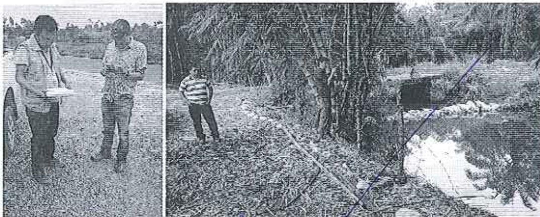
Fotografía 4. Recopilación de información y recorrido por el predio, propiedad de la Compañía AGRO AEREO S.A.