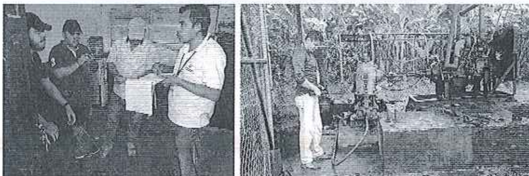
Fotografía 2. Recopilación de información y recorrido por el predio, propiedad de la Compañía Monty Bananas S.A