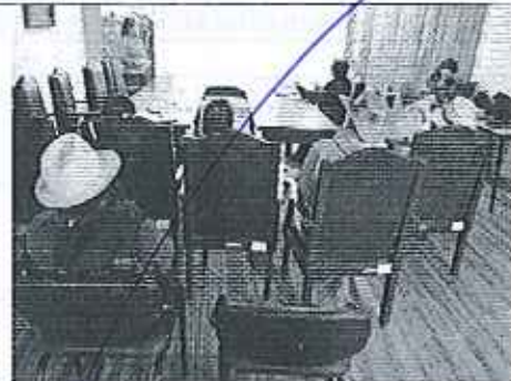
Ilustración 4. Presentación de resultados de la prestación de los servicios al GADM de San Felipe de Oña