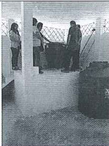
Ilustración 3. Inspección planta de tratamiento GADM de Chinchipe