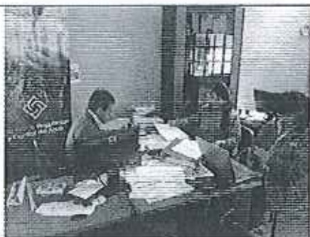
Ilustración 5. Verificación de la información del GADM de San Felipe de Oña