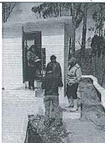
Ilustración 6. Inspección de la planta de tratamiento del GADM de San Felipe de Oña