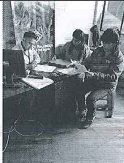
Ilustración 2. Levantamiento de información GADM de Chinchipe