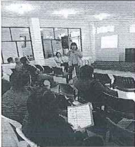
Ilustración 1. Presentación de Resultados de la prestación de servicios al GADM de Chinchipe.