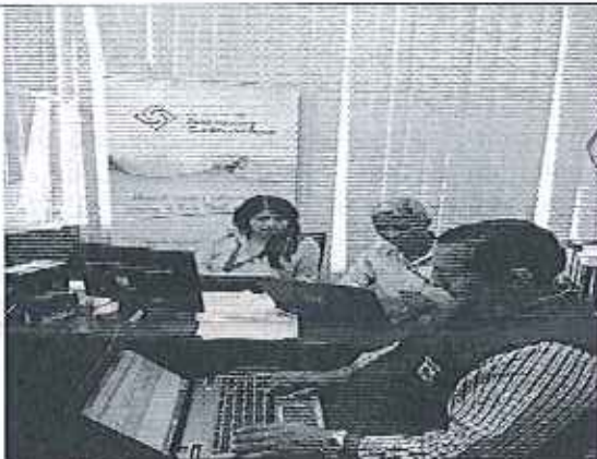
Ilustración 3. Lectura del Acta de control con Vicealcaldesa y funcionarios del GADM.