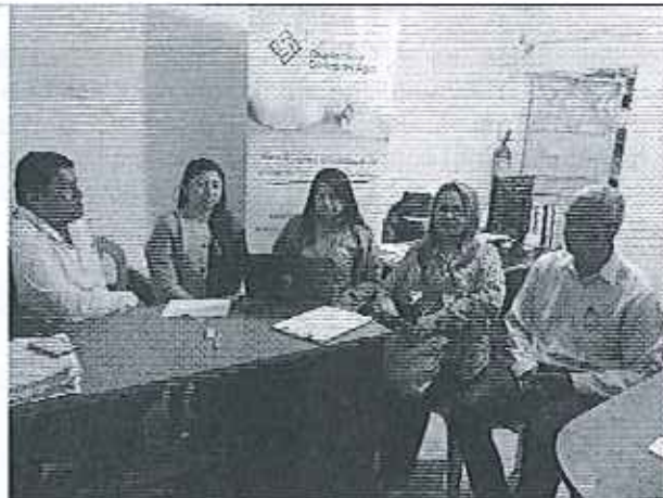
Ilustración 1. Levantamiento de la información con el representante del GADM de Isidro Ayora.