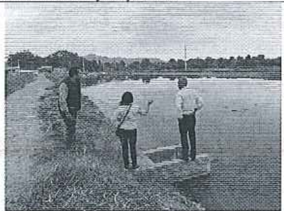
Ilustración 4. Lectura y firma de Acta de compromisos, conjuntamente con los funcionarios del GADM Isidro Ayora y ARCA.