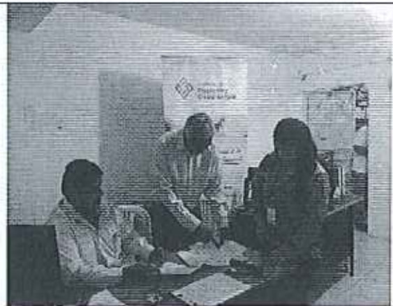
Ilustración 2. Visita e inspección de campo a la planta de tratamiento del GADM Isidro Ayora.