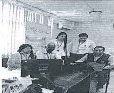
Ilustración 5. Verificación de la información con el delegado del GADM Bolívar