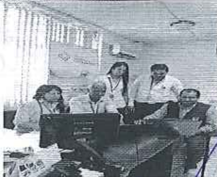
Ilustración 5. Verificación de la información con el delegado del GADM Bolívar