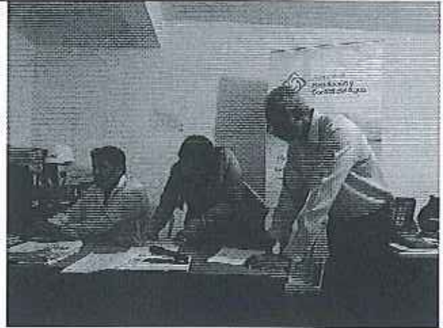
Ilustración 2. Levantamiento de la información en campo con funcionarios del GADM Isidro Ayora.