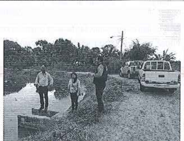
Ilustración 4. Lectura y aprobación del acta de compromisos, conjuntamente con los funcionarios del GADM Isidro Ayora y ARCA.