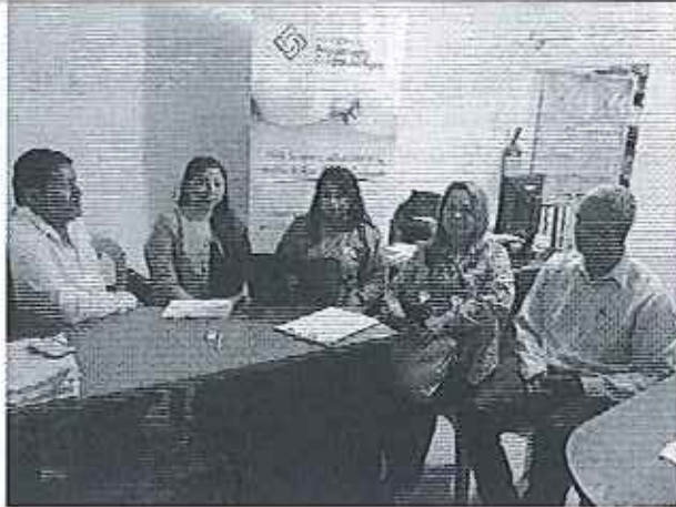
Ilustración 1. Reunión con el asesor del Alcalde y Jefe de Agua y Alcantarillado del GADM de Isidro Ayora.