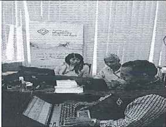
Ilustración 3. Lectura del acta de control con Vicealcaldesa y funcionarios del GADM