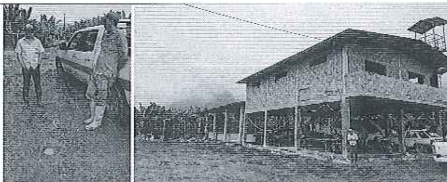
Fotografía 3. Inspección técnica en la Hacienda Filadelfia perteneciente a la compañía KONGPB S.A