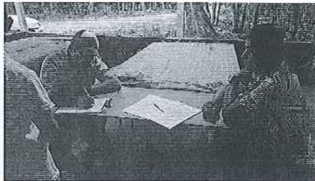
Fotografía 6. Inspección técnica en la hacienda Paraíso