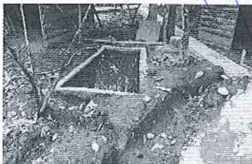
Fotografía 1. Piscina de Patos