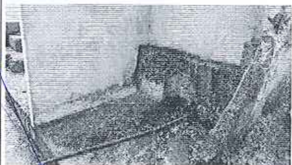
Fotografía 2. Descarga hacia el cauce de la quebrada denominada Campo Real.