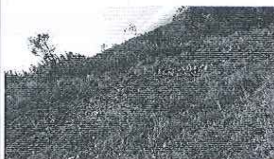
Fotografía 5. Afectación a la cobertura vegetal