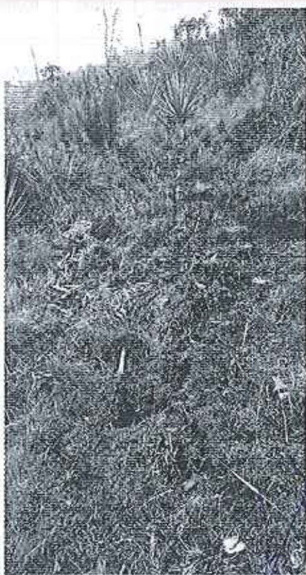
Fotografía 6. Afectación al predio colindante