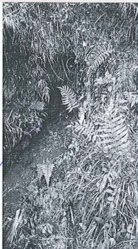
Fotografía 7. Naciente del Cauce Natural