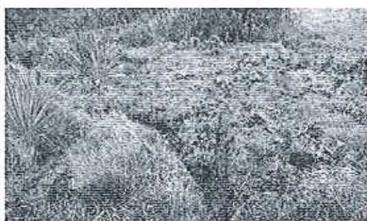
Fotografía 4.. Desborde del Canal