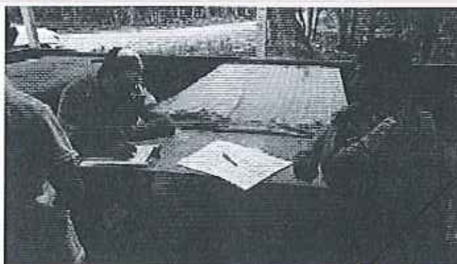
Fotografía 6. Inspección técnica en la hacienda Paraiso