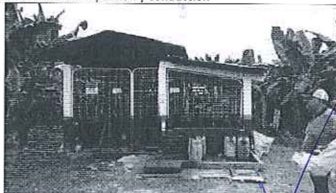
Fotografía 1. Recopilación de información y recorrido por el predio de la propiedad del Sr. Ramiro Siguenza