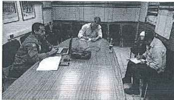
Fotografía 2. Recopilación de información y recorrido por las fuentes hídricas en el predio de la Sociedad Agrícola San Carlos 17:00 – 18:00