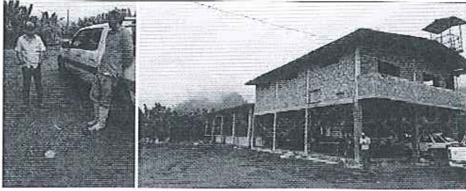
Fotografía 3. Inspección técnica en la Hacienda Filadelfia perteneciente a la compañía KONGPB S.A