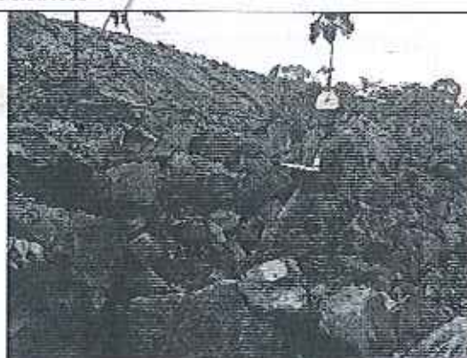
Inspección descarga al río Fermín.