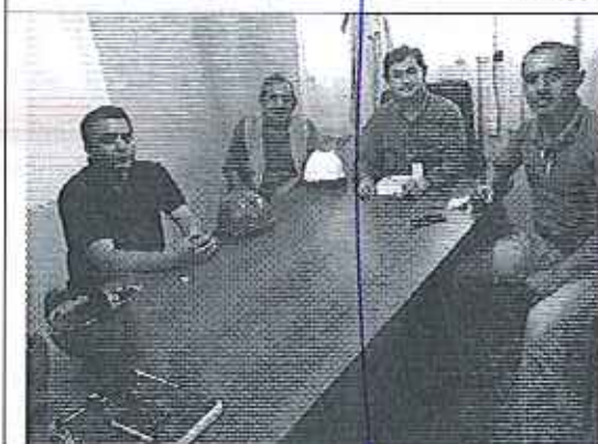
Reunión con denunciante y denunciado.