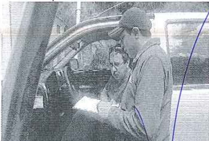
Inspección a HIDROTAVALO C.E.M.