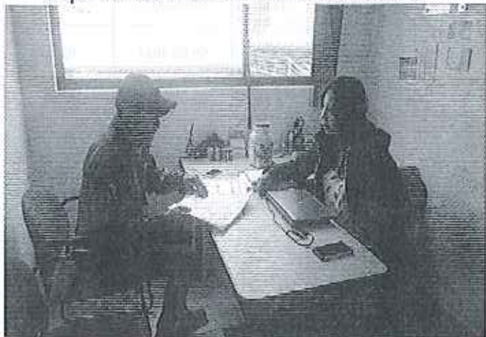
Inspección a ALPINA PRODUCTOS ALIMENTICIOS