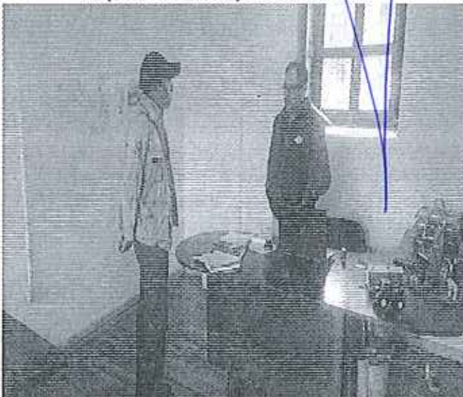
Inspección a Zuleta y Anexas Cía Ltda.