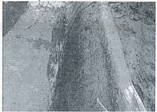
Captación HIDROTAVALO C.E.M.