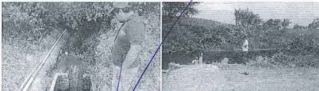
Fotografía 1. Inspección técnica predio denominado La Stevia

✓ Traslado vía terrestre desde la parroquia Chanduy hasta el cantón Salinas para pernoctar.