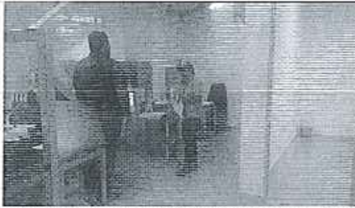
Fotografía 3. Recopilación de información secundaria en las oficinas de la EPA –E.P.