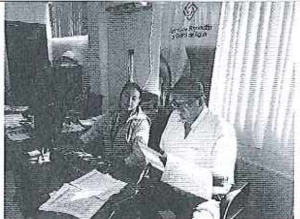
Ilustración 6. Lectura y firma de Acta EMAARS-EP