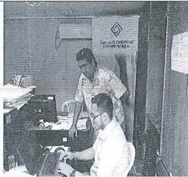
Ilustración 3. Reunión en el GADM de Sucre