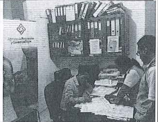
Ilustración 2. Firma de Acta GADM de San Vicente.