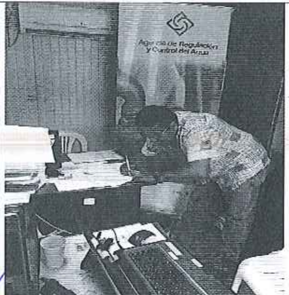
Ilustración 4. Firma de Acta GADM de Sucre