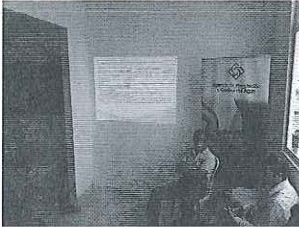
Ilustración 1. Reunión en el GADM de San Vicente.