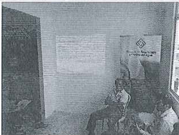
Ilustración 1. Reunión en el GADM de San Vicente.