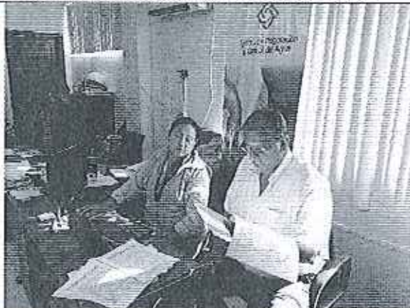
Ilustración 6. Lectura y firma de Acta en la Empresa Mancomunada EMAARS-EP