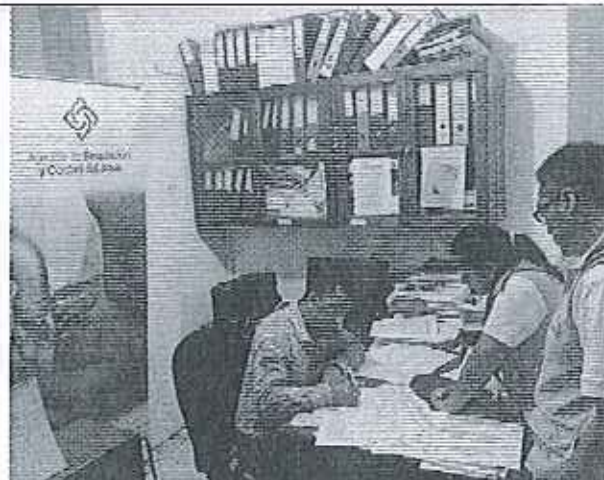
Ilustración 2. Firma de Acta GADM de San Vicente.