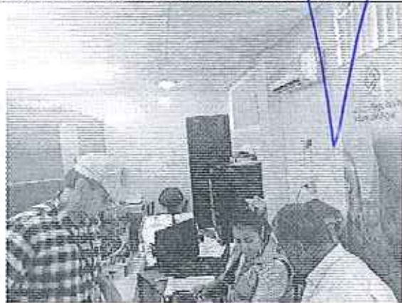
Ilustración 5. Reunión en la Empresa Mancomunada EMAARS-EP