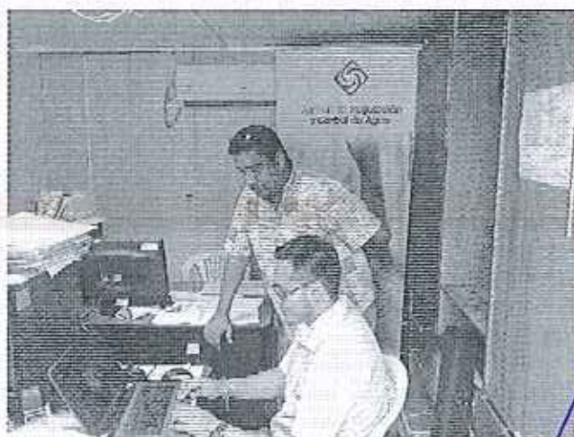
Ilustración 3. Reunión en el GADM de Sucre