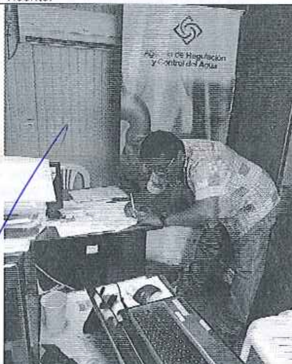
Ilustración 4. Firma de Acta GADM de Sucre