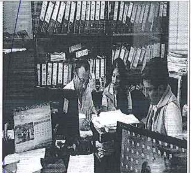
Ilustración 4. Verificación de la información con el delegado del área financiera del GADM.