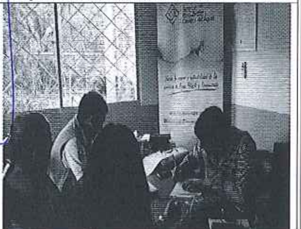
Ilustración 6. Firma de Acta de compromisos, conjuntamente con los funcionarios del GADM Bucay y ARCA.