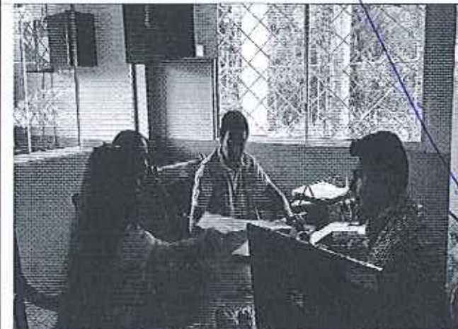
Ilustración 5. Lectura del Acta de control con los funcionarios del GADM de Bucay.