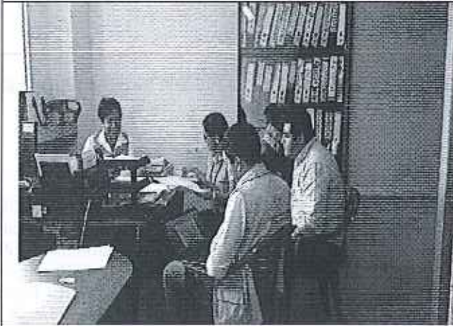
Ilustración 1. Levantamiento de la información con el representante del GADM de El Triunfo.