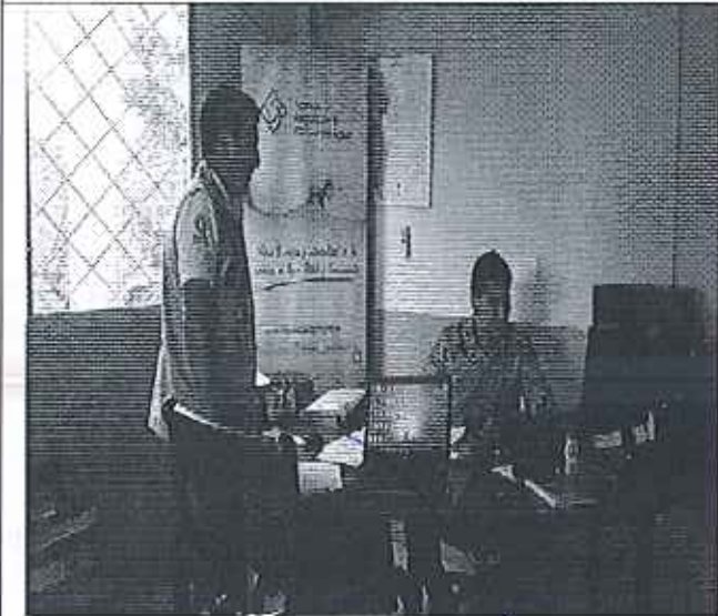
Ilustración 3. Reunión en el GADM de Bucay