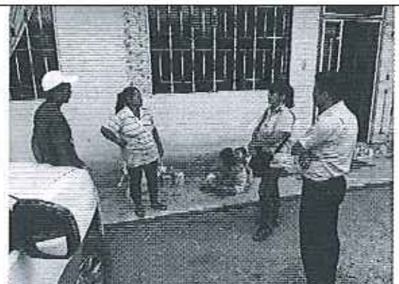
Ilustración 6. Visita a la JAAP de San Vicente.