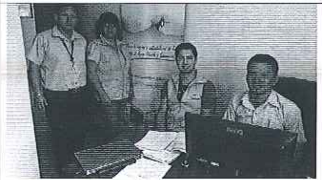
Ilustración 4. Presentación de los análisis de la información remitida a la ARCA por parte del GADM de Santa Clara y verificación de la información.