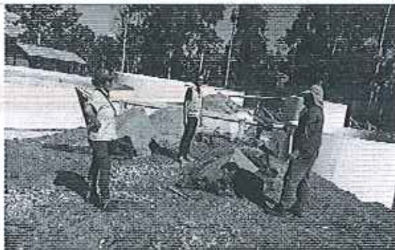
Ilustración 3. Inspección de la planta de tratamiento de agua del GADM de Taisha.