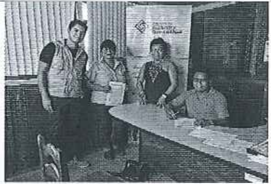
Ilustración 2. Firma del acta de compromisos, conjuntamente con los funcionarios del GADM de Taisha y la ARCA.