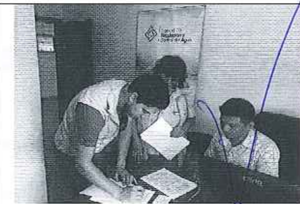
Ilustración 5. Firma del acta de compromisos, conjuntamente con los funcionarios del GADM de Santa Clara y la ARCA.