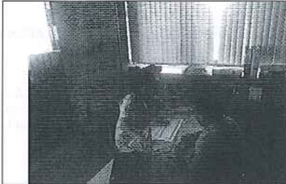
Ilustración 1. Presentación del análisis de la información remitida a la ARCA por parte del GADM de Taisha y verificación de la información.