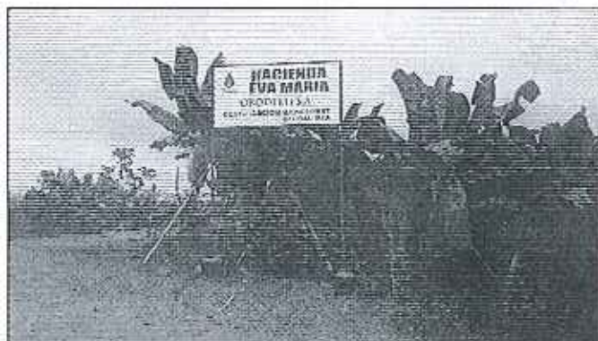
Fotografía 3. Visita técnica y recorrido por las fuentes hídricas en el predio Hda. Eva María.