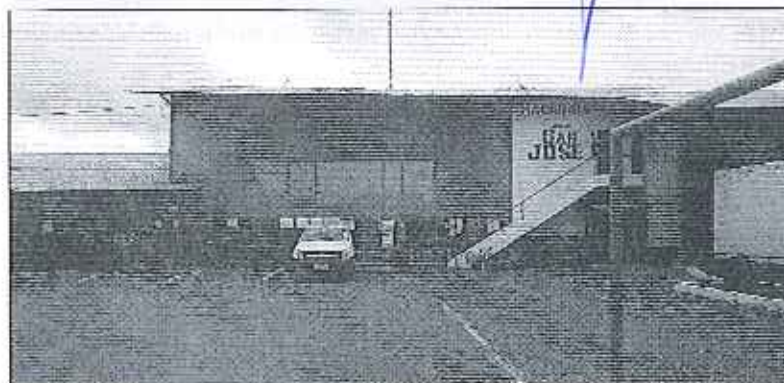
Fotografía 1. Visita técnica y recorrido por las fuentes hídricas en el predio Hda. San José