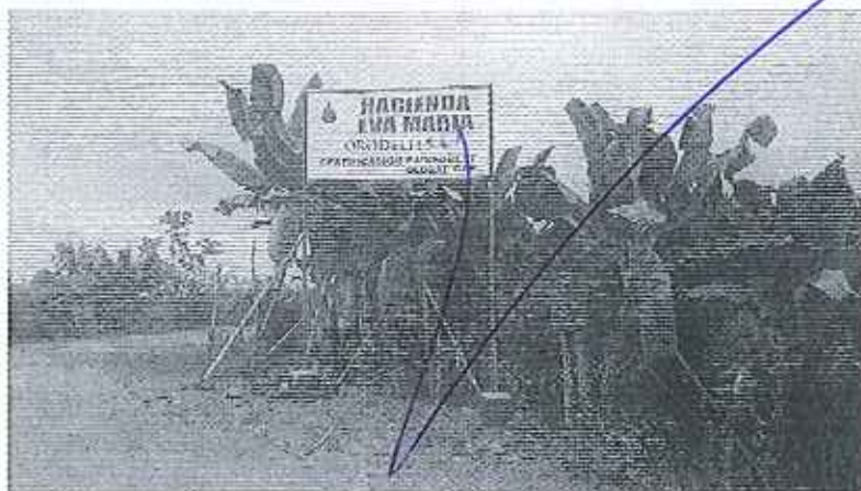
Fotografía 3. Visita técnica y recorrido por las fuentes hídricas en el predio Hda. Eva María.