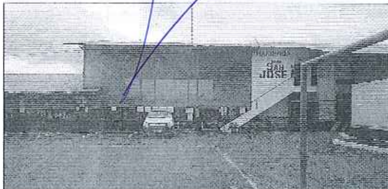
Fotografía 1. Visita técnica y recorrido por las fuentes hídricas en el predio Hda. San José