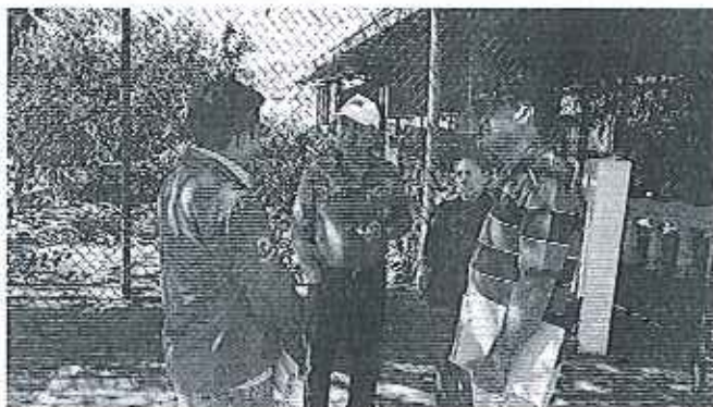
Fotografía 4. Inspección técnica en el predio de la Junta de Riego del Barrio El Paraíso