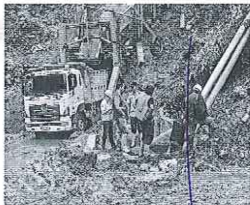
Fotografía 4. Asistentes a la inspección frente el Adriano.