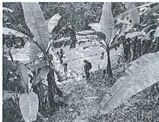
Fotografía 5. Piscinas concesión minera el Guayabo.