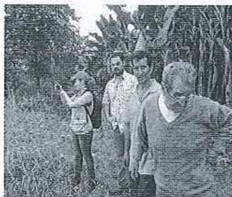
Fotografía 2. Asistentes caso Río Jubones