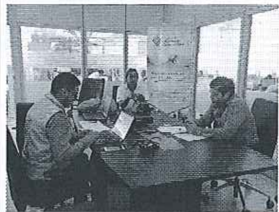
Ilustración 6. Lectura y firma de Acta EAPA-San Mateo