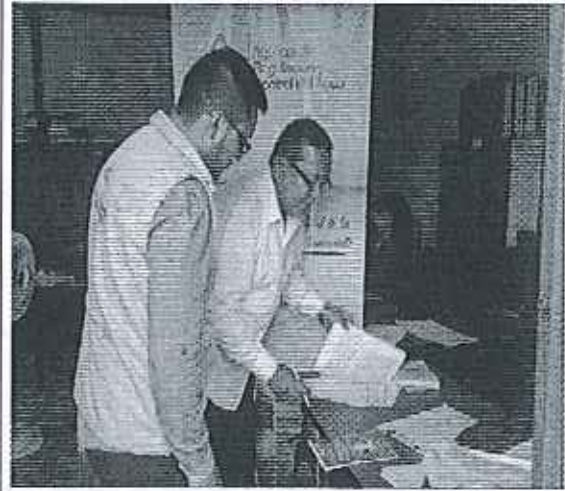
Ilustración 2. Firma de Acta GADM de Muisne