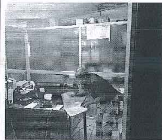
Ilustración 4. Firma de Acta GADM Atacames