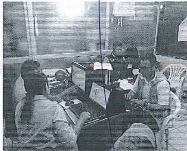
Ilustración 3. Reunión en el GADM de Atacames