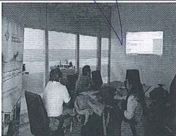
Ilustración 5. Reunión en la Empresa EAPA-San Mateo