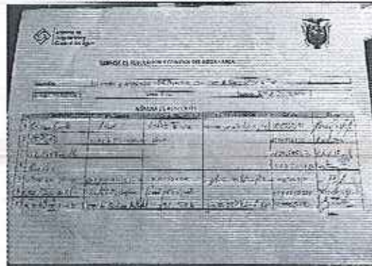
Registro de asistencia a reunión de acuerdos y compromisos.