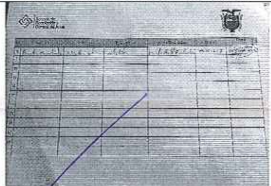
Registro de asistencia a reunión de acuerdos y compromisos.