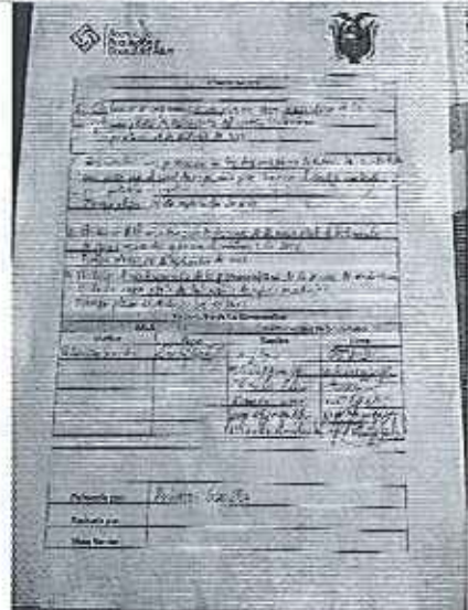
Acta de reunión de acuerdos y compromisos.