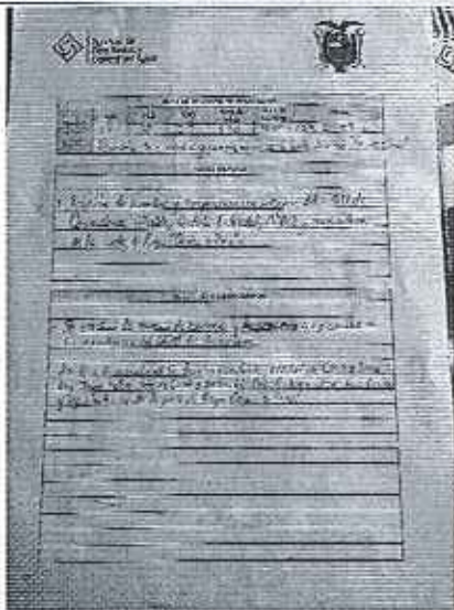
Acta de reunión de acuerdos y compromisos.