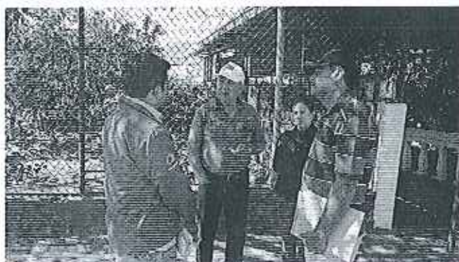
Fotografía 4. Inspección técnica en el predio de la Junta de Riego del Barrio El Paraíso