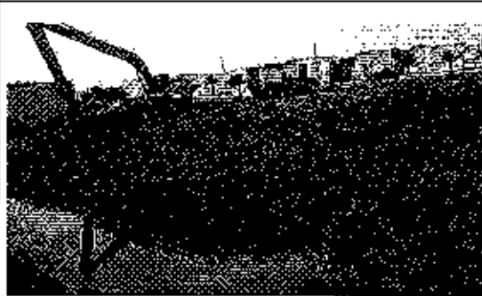
Fotografía 3. Estero la Matanza