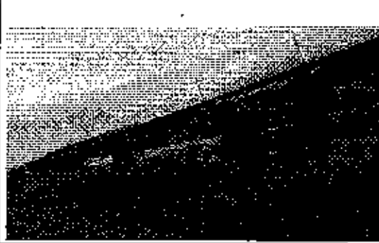
Fotografía 1. Estero La Diablica