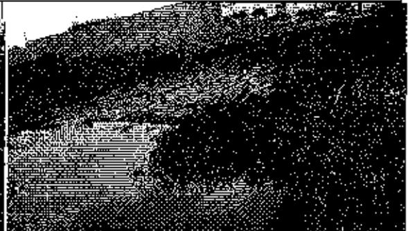
Fotografía 4. Borde izquierdo del Estero La Matanza