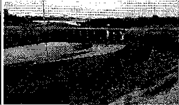
Fotografía 2. Ducto cajón de paso del Estero