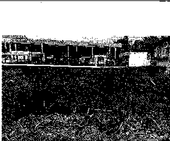
Fotografía 5. Ducto de Agua servidas