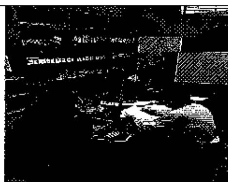
Ilustración 2. Verificación de la información reportada por el GADM de Biblián a la ARCA.