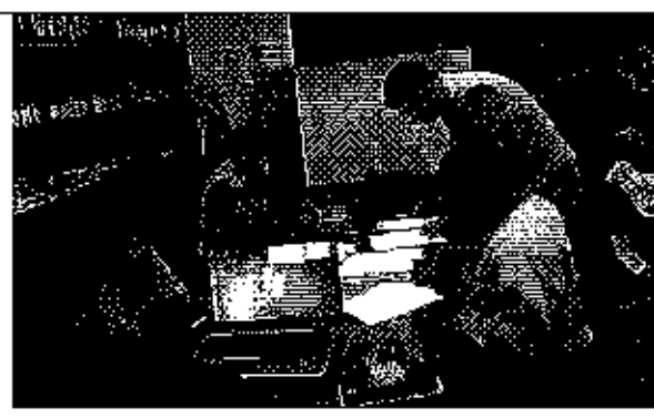
Ilustración 4. Firma del acta de compromisos, conjuntamente con los funcionarios del GADM.