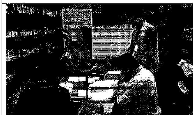
Ilustración 3. Firma del acta de compromisos, conjuntamente con los funcionarios del GADM.