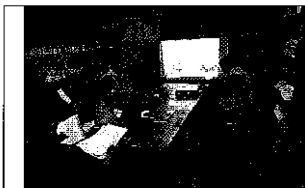
Ilustración 1. Presentación del análisis de la información remitida a la ARCA por parte del GADM de Biblián.