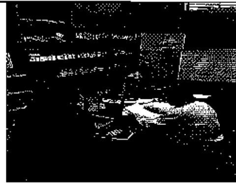
Ilustración 2. Verificación de la información reportada por el GADM de Biblián a la ARCA.