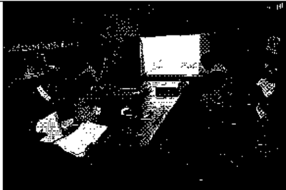
Ilustración 1. Presentación del análisis de la información remitida a la ARCA por parte del GADM de Biblián.