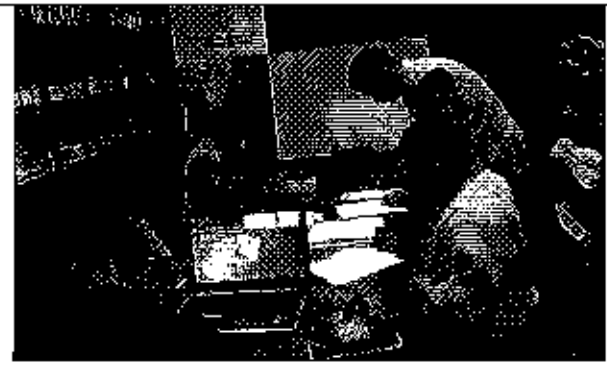
Ilustración 4. Firma del acta de compromisos, conjuntamente con los funcionarios del GADM