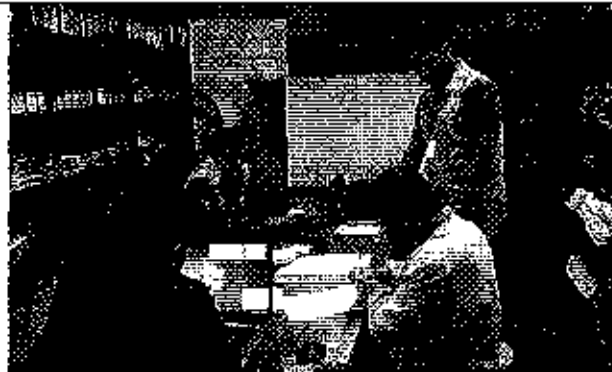
Ilustración 3. Firma del acta de compromisos, conjuntamente con los funcionarios del GADM.