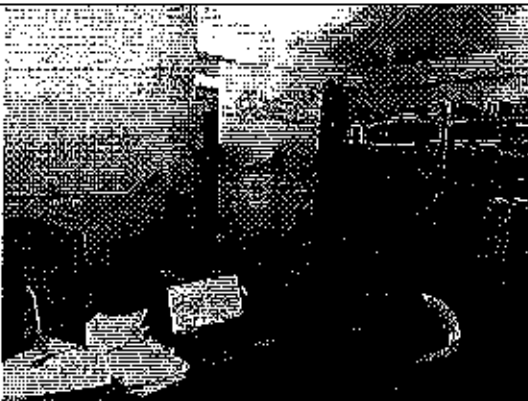
Ilustración 1. Presentación del análisis de la información remitida a la ARCA por parte del GADM de Nangaritza.