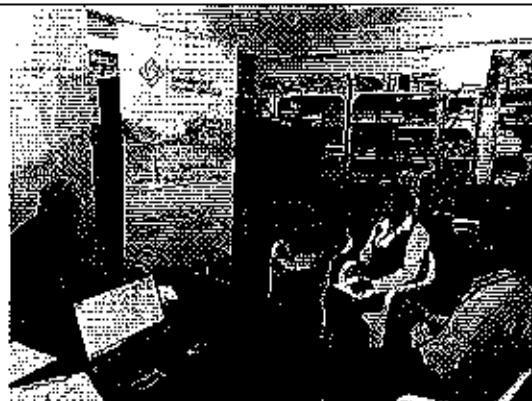
Ilustración 2. Verificación de la información reportada por el GADM de Nangaritza a la ARCA.