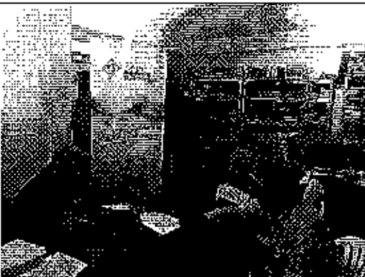
Ilustración 3. Firma del acta de compromisos, conjuntamente con los funcionarios del GADM de Nangaritza.