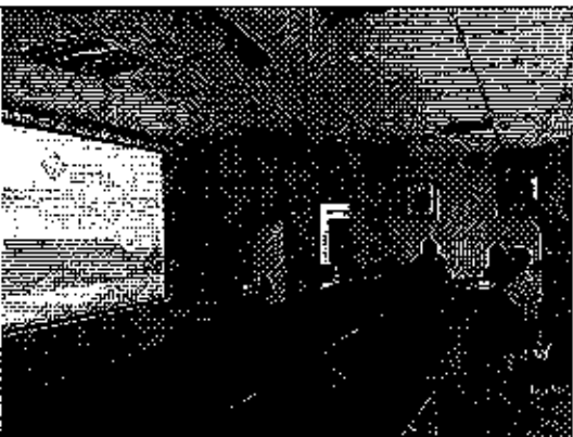
Ilustración 5. Presentación del análisis de la información remitida a la ARCA por parte del GADM de Centinela del Cóndor.