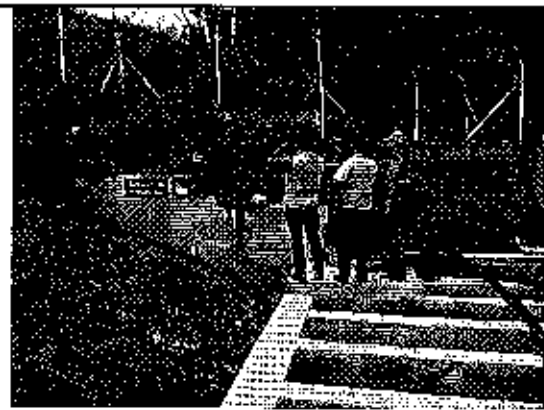
Ilustración 8. Inspección de la planta de tratamiento de agua potable del GADM Centinela del Córdo