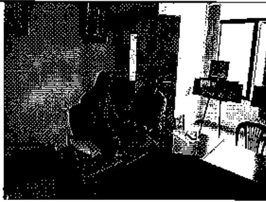
Ilustración 7. Firma del acta de compromisos, conjuntamente con los funcionarios del GADM de Centinela de Córdo.