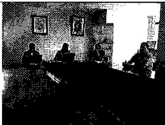
Ilustración 6. Verificación de la información reportada por el GADM de Centinela del Cóndor a la ARCA.