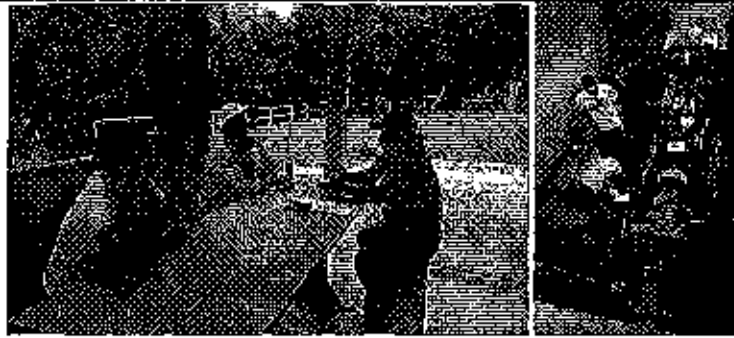
Fotografía 3. Inspección técnica al predio denominado Rancho Paraiso.