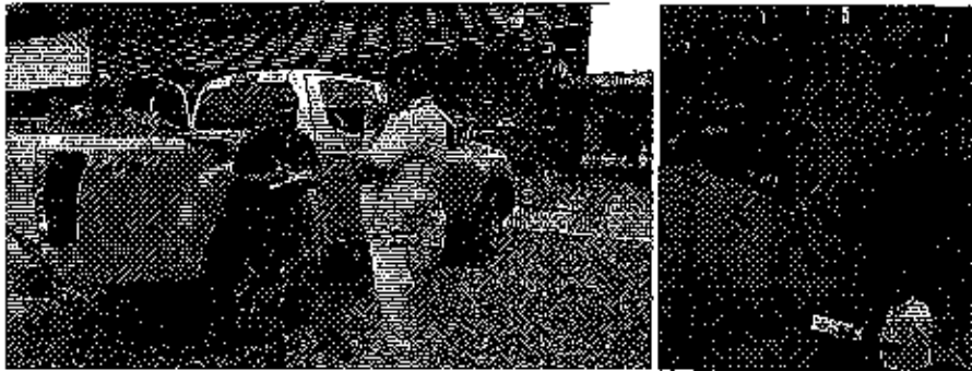
Fotografía 1. Inspección técnica predio denominado Hacienda Doménica