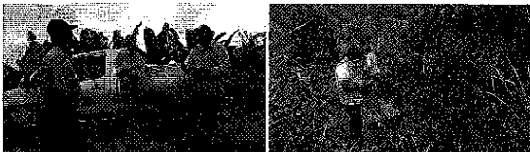
Fotografía 4. Izq. Inspección técnica al predio denominado Hcda. El Chalacal. Der. Inspección al predio denominado Hcda. Santa Elena

✓ Traslado vía terrestre desde el cantón Santa Rosa hacia la ciudad de Machala para pernoctar.